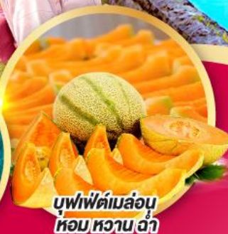
บุฟเฟ่ต์เมล่อน หอมหวานฉ่ำ