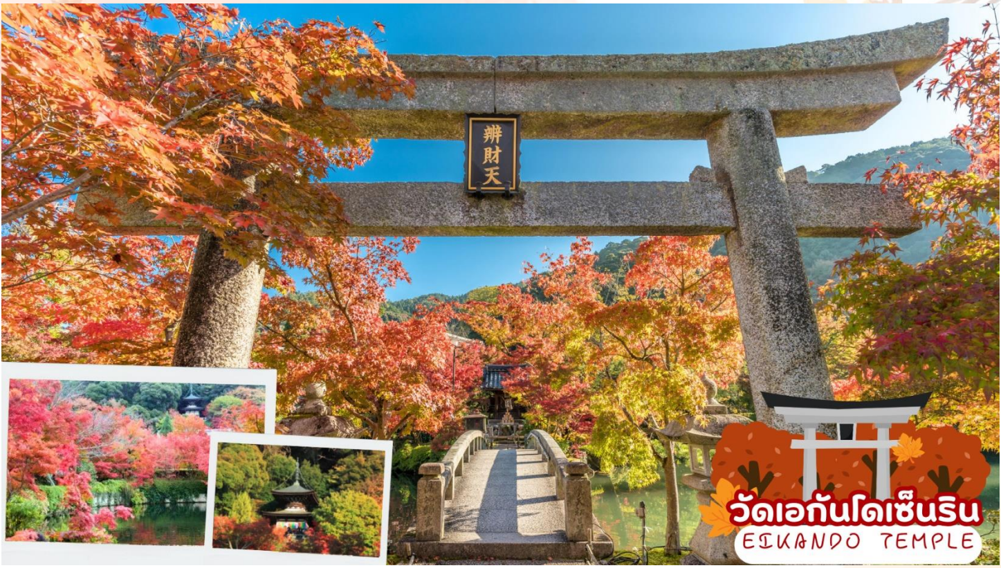
วัดเอกันโดเซ็นริน EIKANDO TEMPLE

ๆ ที่เต็มไปด้วยประวัติศาสตร์และวัฒนธรรมดั้งเดิมของญี่ปุ่น