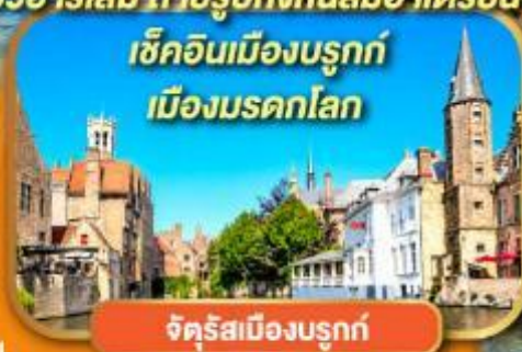
จัตุรัสเมืองบรูกก์