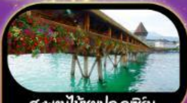
สะพานไม้อาปลค ลูซิริน