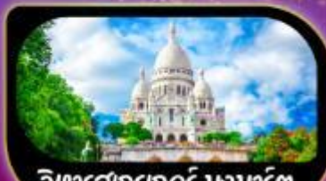
วิหารสกรทอร์ มงมาร์ต