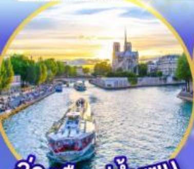
ล่องเรือแม่น้ำเซน