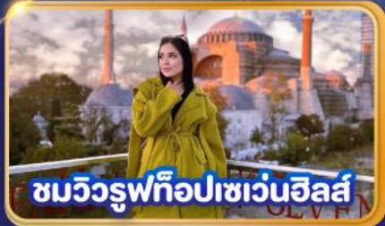
ชมวิวยุโรปเซเวนฮิลส์