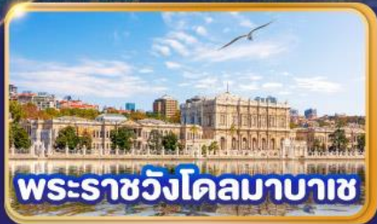
พระราชวังโคลมาบาซ