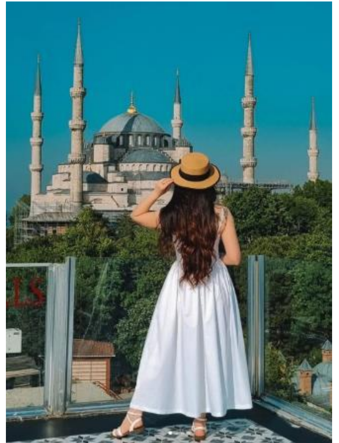
สมควรแก่เวลา นำท่านเดินทางสู่สนามบินอิสตันบูล