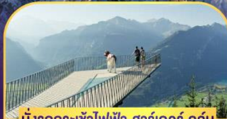
นั่งรถกระเช้าไฟฟ้า ชาร์เดออร์ คูสุม