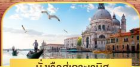
นั่งเรือสุทเกาะเวนิส