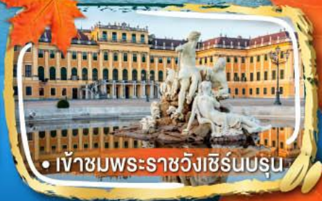
• เข้าชมพระราชวังเซิร์นบรุน