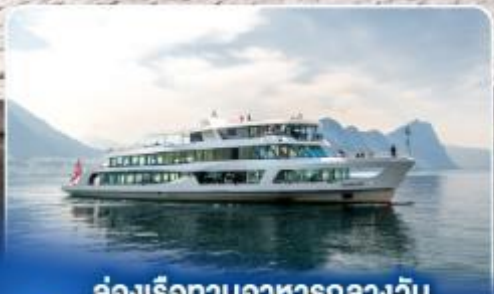
ล่องเรือทานอาหารกลางวัน ทะเลสาบลูซิิร์น