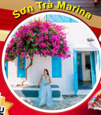
Son Trà Marina