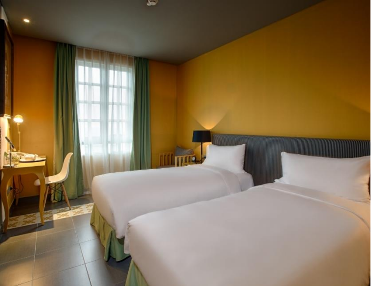
📍 นำท่านเข้าสู่ที่พัก Mercure Ba Na Hill ระดับ 4 ดาว หรือเทียบเท่า (บานาฮิลล์)