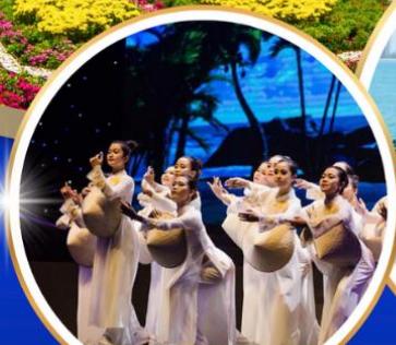
Charming Danang Show